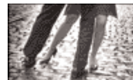
Tango in der Stadt

Von Juli bis September tanzen Tangobegeisterte freitags (nur bei trockenem Wetter!) auf dem Platz! Am 15.08.03 treffen sich alle Tänzer auf dem Grabbeplatz.