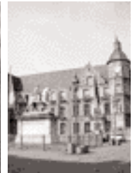
Plätze des Parcours